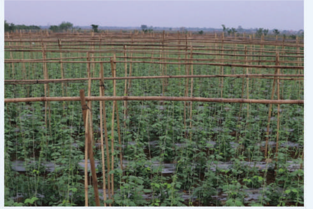
व्यवसायिक तरकारी खेती, नवलपुर