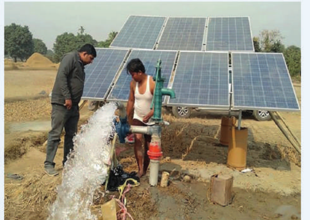
सौर्य सिंचाइमार्फत बोरिङ जडान, भापा