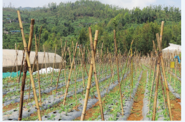
व्यवसायिक तरकारी खेती, धादिङ