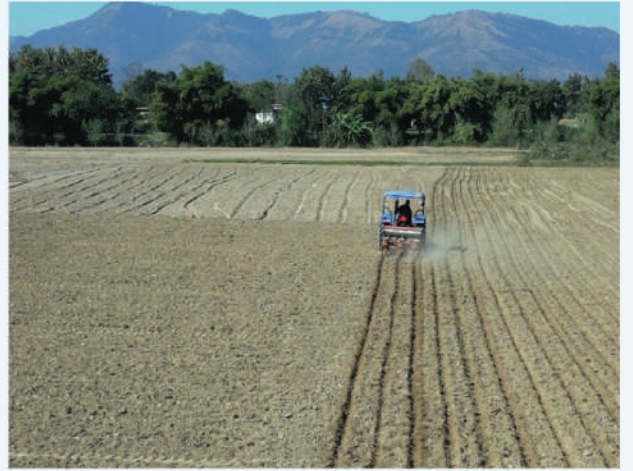
मेसिनबाट मकै छर्ने प्रविधि, दाङ