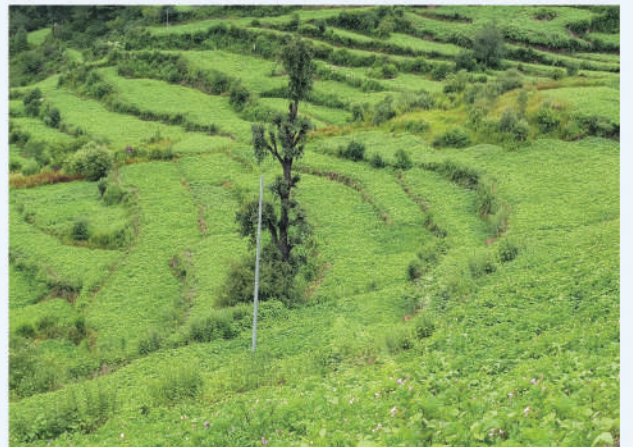
व्यवसायिक सिमी खेती, मुगु