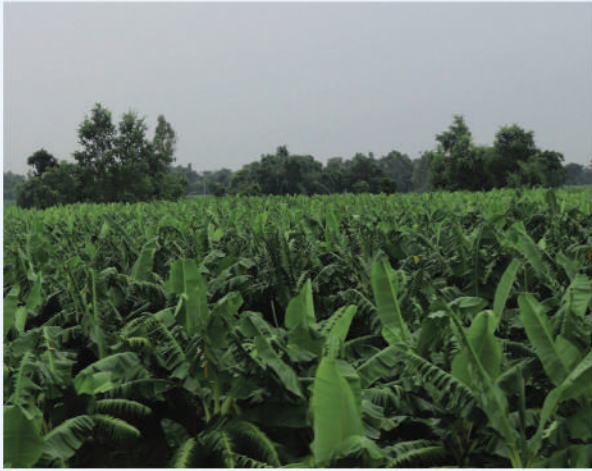
व्यवसायिक केरा खेती, रौतहट