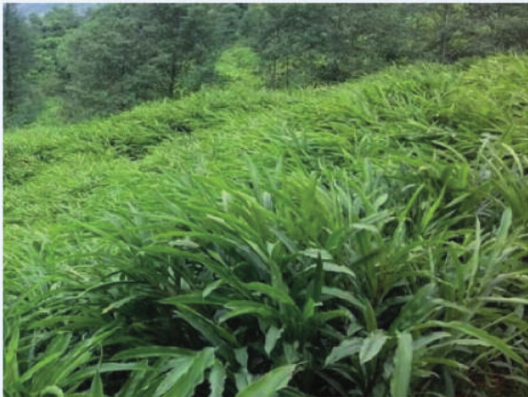
व्यवसायिक अलैंची खेती, ताप्लेजुङ