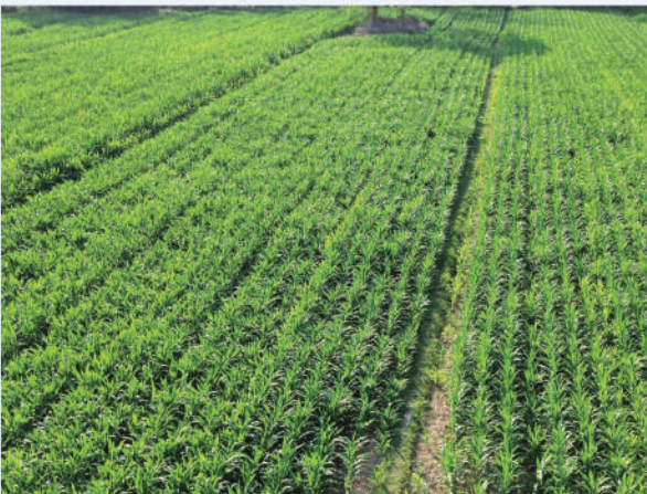
स्वदेशी हाइब्रिड मकै बीउ उत्पादन कार्यक्रम, भ्पापा