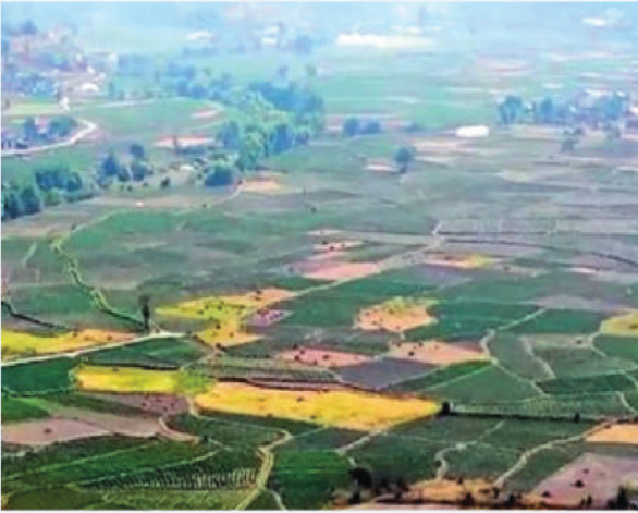
चक्लाबन्दीमा आलु खेती, डडेलधुरा