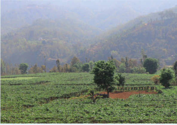
व्यवसायिक तरकारी खेती, धादिङ