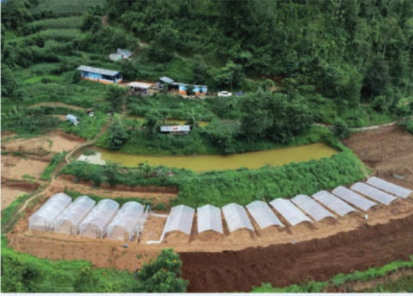
व्यवसायिक तरकारी खेतीका लागि गह्रा सुधार कार्यक्रम रेसुङ्गा, गुल्मी