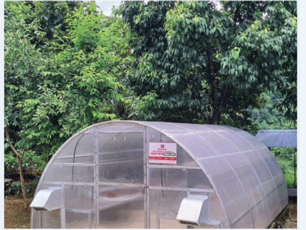
अलैंची सुकाउन सोलार ड्रायर घर निर्माण सहयोग, कास्की